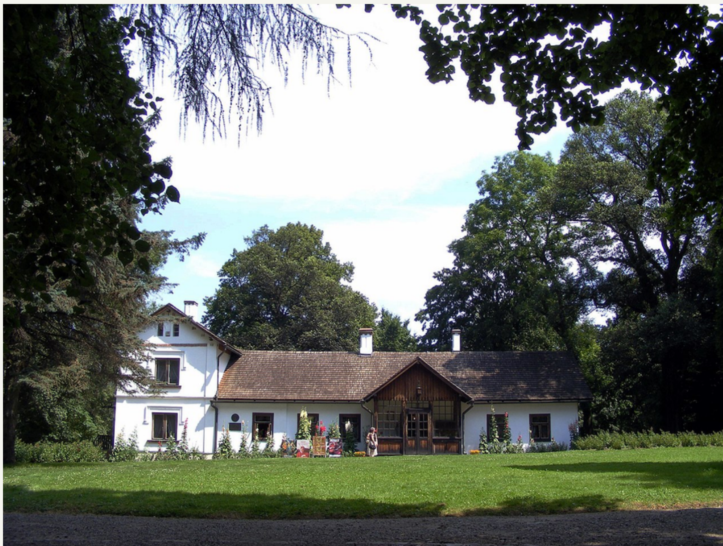
Dwór w Żarnowcu, prezent od narodu dla Marii Konopnickiej