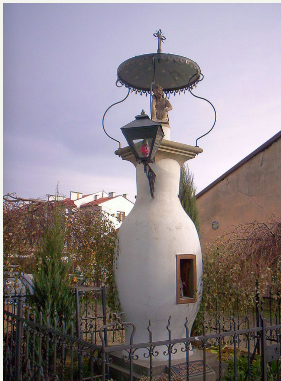
Miejsce zapalenia pierwszej na świecie ulicznej lampy naftowej w Gorlicach